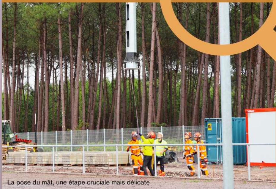
La pose du mât, une étape cruciale mais délicate